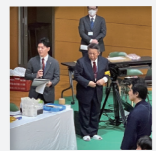
区剣道大会開会式 副会長として司会を担当