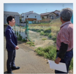
地域の陳情対応の様子