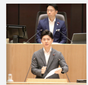
本会議でのまちづくり委員長報告の様子