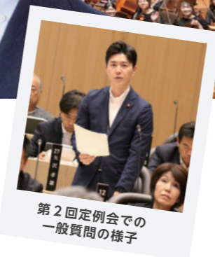
第2回定例会での一般質問の様子

A (健康福祉局長) 利用者とのギャップの解消及び最適なマッチングに向けた取組は重要であると考えている。年度内にはグループホームの運営法人や関係団体、区役所、障害者相談支援センターとの意見交換を行い、現計画の最終年度となる令和8年度を目処に待機状況の情報集約、利用実態の把握を行うなど、入居希望者の支援体制を強化していきたい。