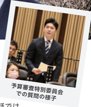
予算審査特別委員会での質問の様子

今年7月には、いよいよ市制100周年を迎えます。定例会の冒頭、市長から、この市制100周年という歴史的な節目に、川崎の発展を支えてきた「多様性」の価値を改めて共有し、未来に向けた活力ある「あたらしい川崎」を生み出していく新たなスタートラインとして、市民、企業、団体等の皆様と手を携えながら、「多様で多彩なアクション」を生み出していけるよう取り組んでいくとの発言がありました。100年前は、関東大震災の発生直後で、まさにその復興の中で誕生した川崎市です。この機会に、改めて多くの方に、川崎を「知って・関わって・好きになっていただく」取組を行政とともに進め、100年後の未来に向けて、誰もが笑顔で暮らすことのできる安心・安全のまちとなるよう更なる発展を目指していく事こそが我々の使命と再認識し、次のあたらしい川崎の100年を皆様と一緒に作り上げてまいります。