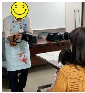
スポットビジョンクリナー(SVS)を活用した検診の様子

小児の近視有病率増加の原因として、スマートフォンをはじめとしたデジタルデバイスの使用環境があると考えられています。選挙公約では、スクリーンタイム制限設定の推奨等に加え、斜視や弱視の早期発見を目的としたSVS(スポットビジョンクリナー)導入を掲げ、全区への配備が完了。現在、3歳児眼科検診で活用されています。