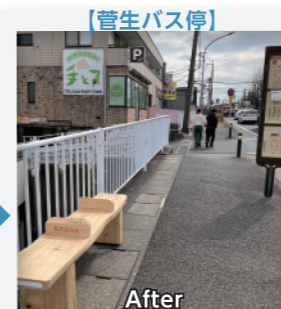
【管生バス停】 民間バス停へのベンチ整備制度の創設