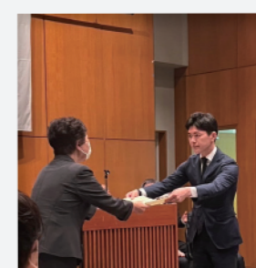
川崎市議会議員選挙 当選証書授与式