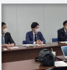
自民党川崎市連約に関する記者会見