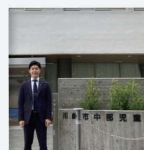
市中部児童相談所視察