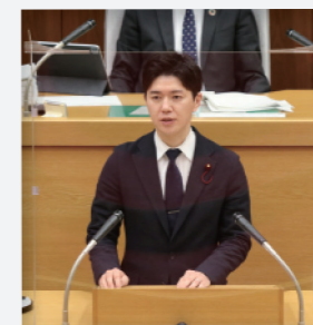
(健康福祉委員長) 委員会報告の様子