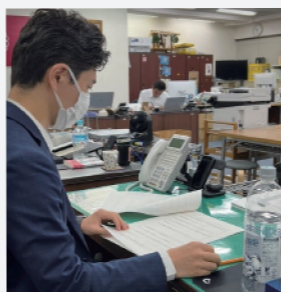
日々の市役所市議団控室の様子