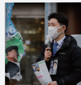
日々の駅頭市政報告の様子