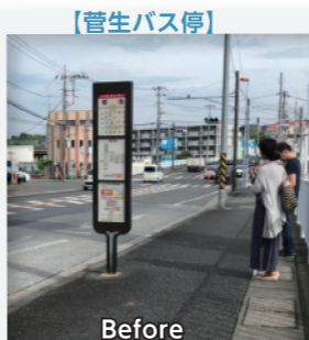
【管生バス停】 従来の民間バス停